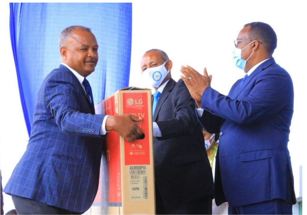
የ2013 በጀት ዓመት የላቀ የሥራ አፈጻጸም ተሸላሚዎች ሽልማታቸውን ሲቀበሉ፤