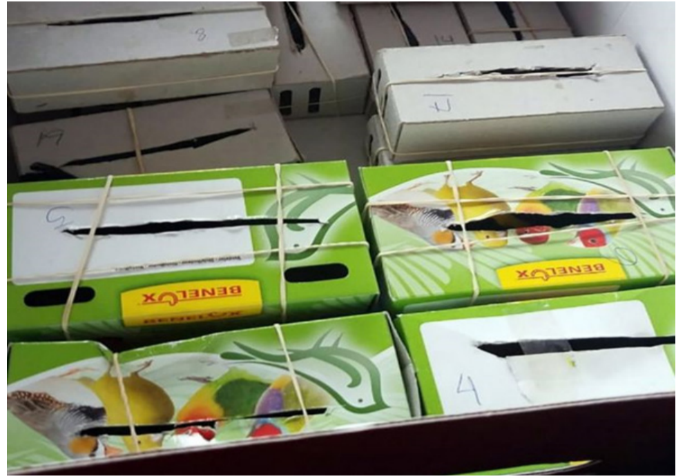
ወሬቹ በትናንሽ ካርቶኖች ውስጥ በዚህ መልክ ነበር የታሸጉት፤