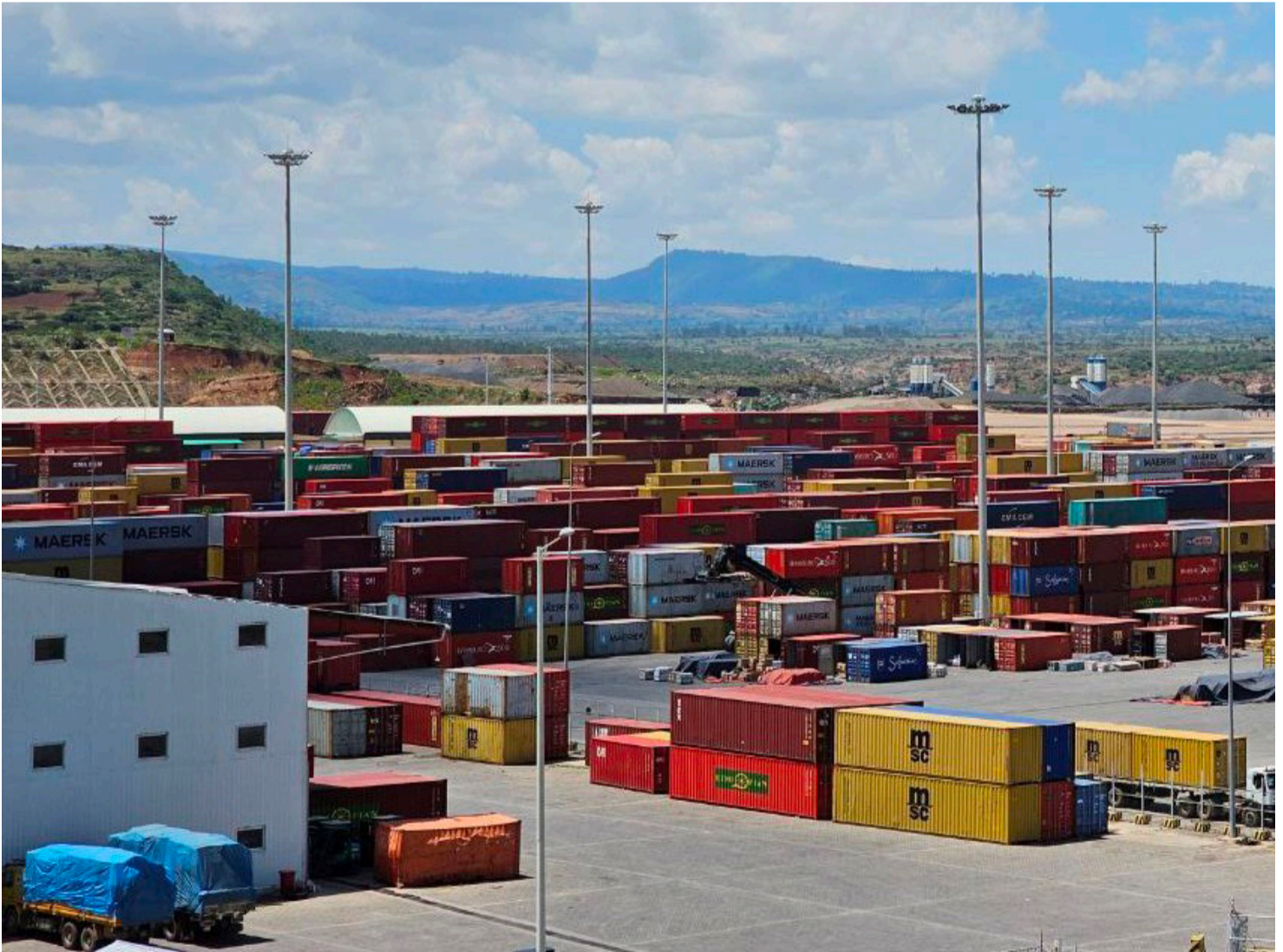
የሞጆ ደረቅ ወደብ።

ምንም እንኳን በሃገራችን ቴክኖሎጂን መጠቀም ላይ ውስንነቶች ቢስተዋሉም በዓለም ዓቀፍ ገበያ ላይ ተወዳዳሪ ሆኖ ለመቅረብ የተለያዩ ቴክኖሎጂዎችን መጠቀም አማራጭ የለውም። ስለሆነም ባለሀብቶች ይህንን አሠራር ተግባራዊ ማድረግ ይጠበቅባቸዋል። ማንኛውም የህብረተሰብ ክፍል ደግሞ በተሰማራበት የሥራ መስክ ለቀልጣፋ እና ለውጤታማ ሥራ መትጋት ይጠበቅበታል።