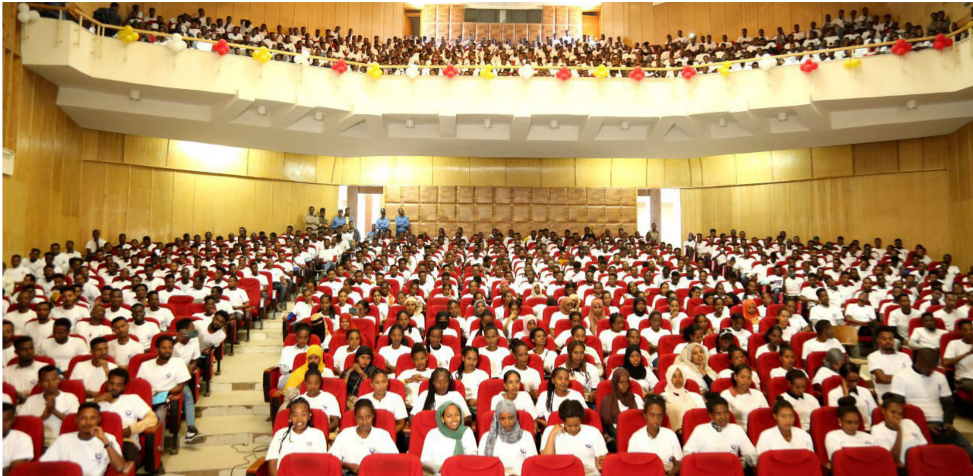
ምልምል የጉምሩክ መኮንኖች፤

ይህ አምድ የታክስ አስተዳደርና የጉምሩክ አሠራር የሚመራበትን ሀገራችን፣ መመሪያዎችና አሰራሮች፣ ለሕግ ተገዢነት የሚያስተምሩ አስተሳሰቦችን፣ ሕጎችን ለአሠራር ምቹ የሚያደርጉና ፍትሃዊ የንግድ ውድድርን የሚያገለግሉ አሰራሮችንና ተሞክሮዎችን የሚያስተዋውቅ ጽሑፍ ይቀርብበታል።