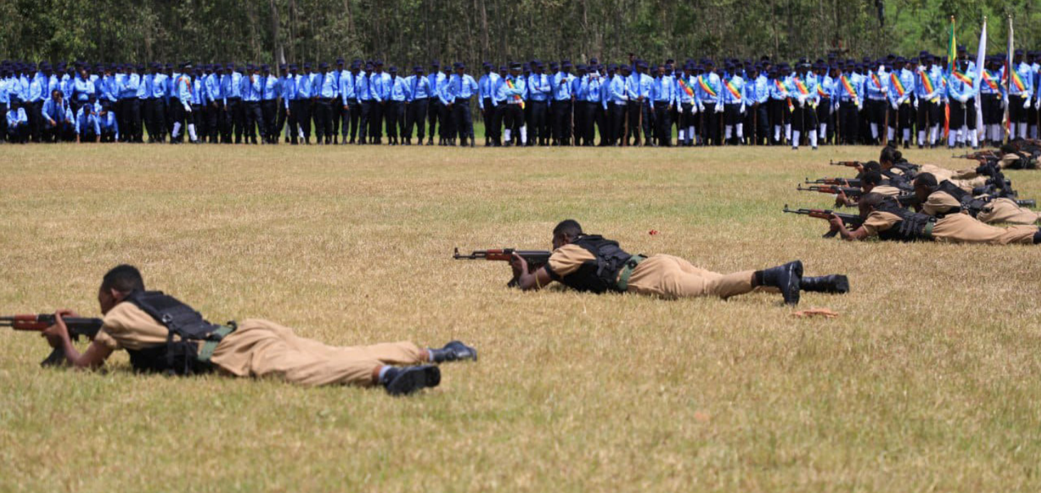
የጉምሩክ መኮንኖች ተመርቀው ወታደራዊ ትርዒት ሲያቀርቡ፤

የድሬዳዋ ከተማ አመሠራረት ከአዲስ አበባ ጂቡቲ የምድር ባቡር ዝርጋታ ጋር የተያያዘ ነው፡፡ በዚህ ወቅት ዕቃዎች ከጂቡቲ አስከሬን ድሬዳዋ ተጫኝው፣ ከድሬዳዋ በኋላ በጫኝት አንስሳት እየተጓዙት አዲስ አበባ ይደርሱ ነበር፡፡ ይህ ሁኔታ ከተማዋ ለብዙ ዓመታት ዋና የኢትዮጵያ ጉምሩክ የሚገኝበትና የጉምሩክ ቀረጥና ታክስ የሚሰበሰብበት በከፍተኛ ፍጥነት እንድታደግ አግዟታል፡፡