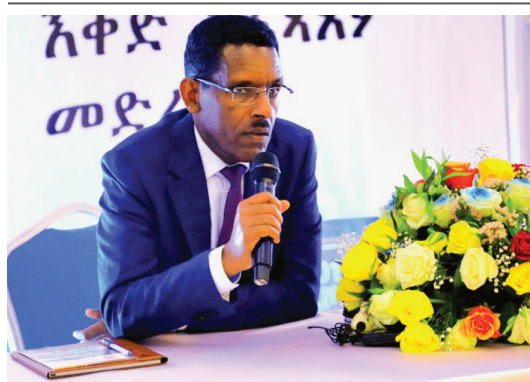
ክቡር ደበሌ ቀበታ